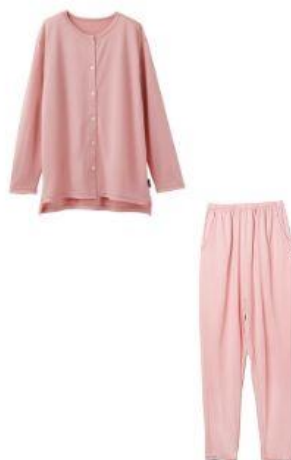
ロングスリーブ フロントオープン + ロングテーパードパンツ 30,800円（税込）