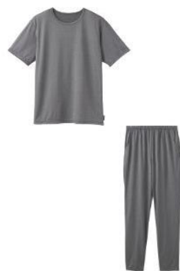
ショートスリーブ + ロングテーパーパンツ 27,500円（税込）