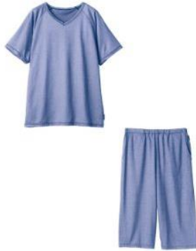
ラグランスリーブ Vネック + ひざ下丈パンツ 26,400円（税込）