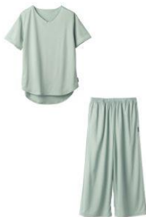
ショートスリーブ + ガウチョパンツ 26,400円（税込）