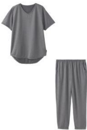
ショートスリーブ + 8分丈テーパードパンツ 26,400円（税込）

※ラベンダーは『母の日にリカバリーギフトセットA』のみかつ、一部店舗限定：伊勢丹新宿店 本館5階、高島屋横浜店 5F、ジェイアール名古屋タカシマヤ 9F、伊勢丹立川店 6階、VENEX 公式オンラインストア、VENEX 公式楽天市場店、VENEX 公式Yahoo!店、Amazon