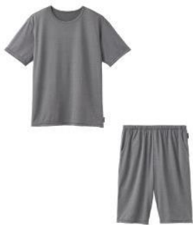
ショートスリーブ + ハーフパンツ 24,200円（税込）