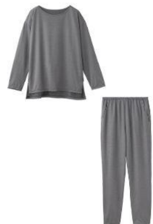
サイドスリットロングスリーブ + ロングテーパードパンツ 30,800円（税込）