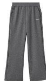
Recovery Move ワイドパンツ 17,600円 (税込) ※