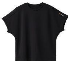
Recovery Move ショートスリーブ 11,000円 (税込) ※