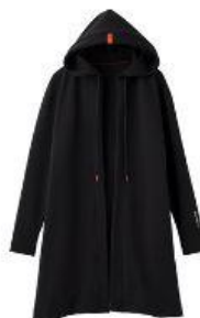
Recovery Move カーディガン 19,800円 (税込)