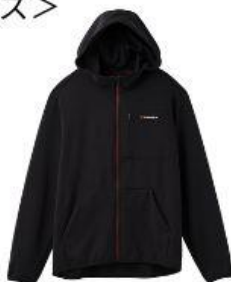
Recovery Move ジップアップフードジャケット 24,200円 (税込)