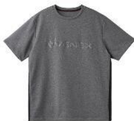
Recovery Move エンボスロゴTシャツ 15,400円 (税込) ※