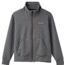
Recovery Move スタンドカラージャケット 19,800円 (税込)