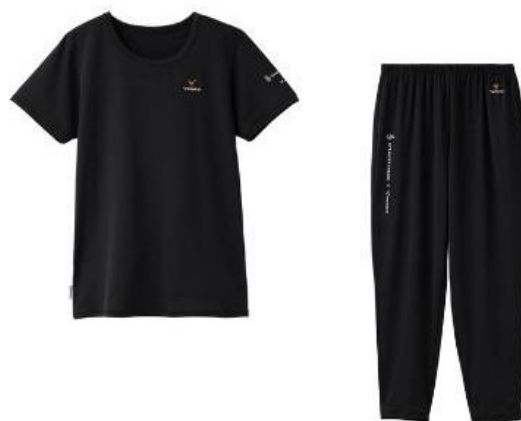
〈渡邊凌磨×VENEX〉リフレッシュセットアップ 20,900円(税込)