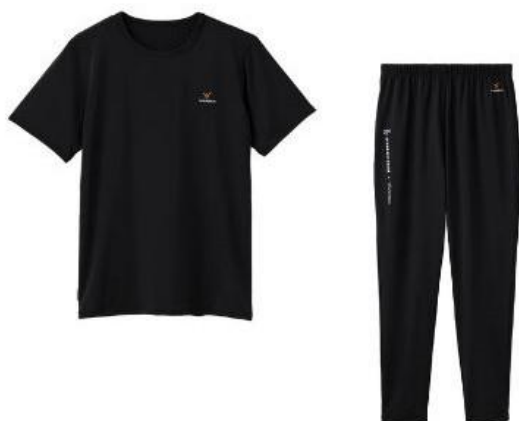
〈渡邊凌磨×VENEX〉リフレッシュセットアップ 20,900円(税込)