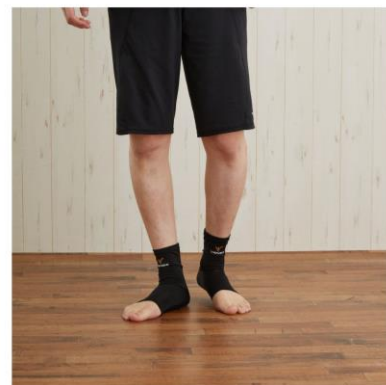
アングルコンフォート