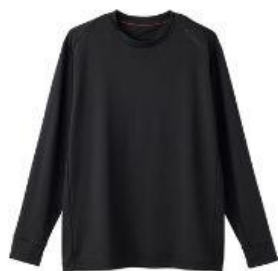
スタンダードドライ+ ロングスリーブ クルーネック 17,600円（税込）