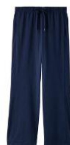
スタンダードドライ+ フレアパンツ 18,700円（税込）