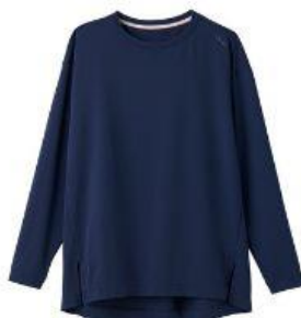
スタンダードドライ+ ポートネック ロングスリーブ 17,600円（税込）