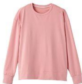
スタンダードドライ+ ロングスリーブ クルーネック 17,600円（税込）