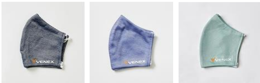
左から、カラー：ネイビー、ブルー、ミント

オンラインストア：ベネクス公式オンラインストアのみ、3 枚セット（各色 1 枚）：4,500 円（税別）での販売となります。