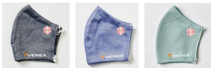
左から、カラー：ネイビー、ブルー、ミント