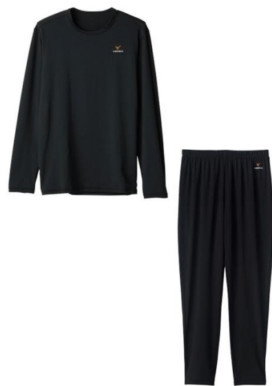
〈館内着のリカバリーウェア〉